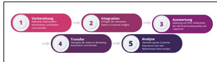
Customer Insights Prozess

Mithilfe umfangreicher Analyse –Tools optimieren Sie die Customer Experience Ihre KundInnen.